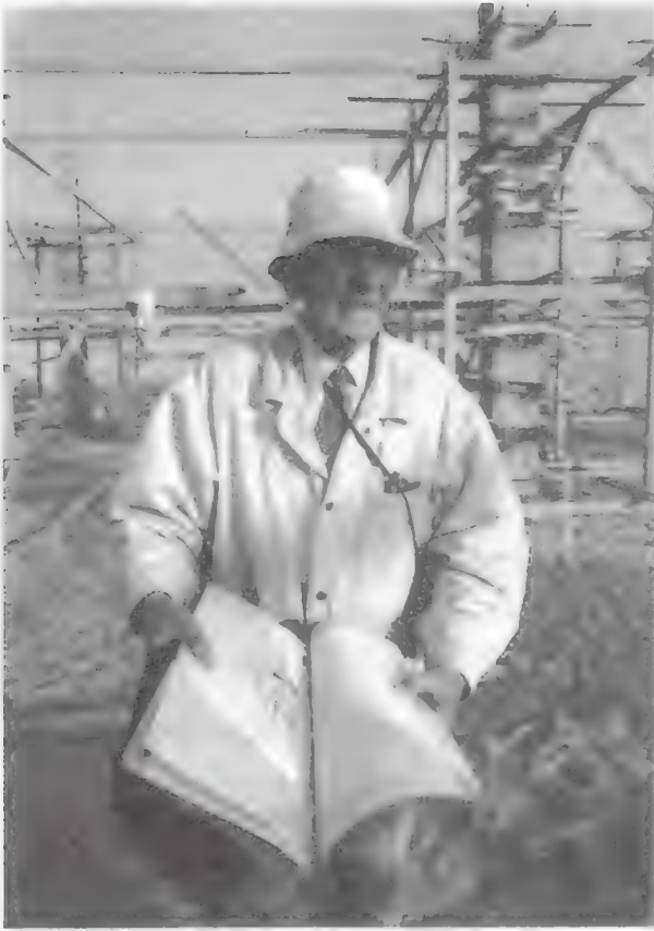
لوير أمام أساسات متحفه عام ١٩٩٥ والذي أمر بهدمه وزير الثقافة